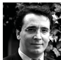
Bernard Benhamou - Délégué aux Usages de l'Internet auprès de la Ministre de l'Enseignement supérieur et de la Recherche

www.km2.net www.anoptique.com www.perspective-numerique.net