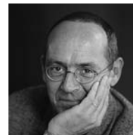
Bernard Stiegler - Directeur de l'Institut de recherche et d'innovation du Centre Pompidou

Contextes pluriculturels et identités. Recherches actuelles en psychologie Paris, Sides, 2005, pp. 185-215